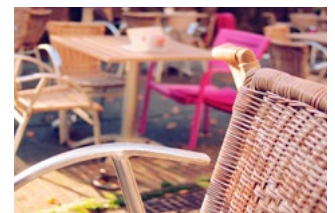
8 NOW (Tijdelijke Noodmaatregel Overbrugging Werkgelegenheid)