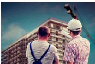
5 Wet DBA