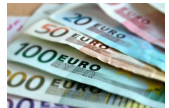
4 Wet tegemoetkomingen loondomein