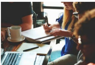
1 Varia loon- en premieheffing

We hebben de special reeds een update gegeven vanwege het nieuwe steunpakket dat in januari 2021 is gepubliceerd.