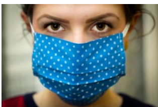
9 Corona en bijzonderheden werknemer