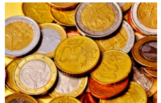
4 Wet tegemoetkomingen loondomein