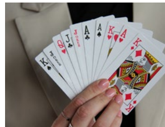
7 Varia arbeidsrecht en sociaal zekerheidsrecht