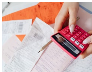
2 Tips voor de ondernemer in de inkomstenbelasting