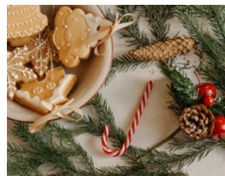
3 Tips voor de bv en de dga