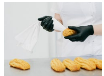
8 Tips inzake belasting- schulden coronacrisis en/of huidige (energie)crisis