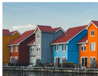
6 Tips voor de woningeigenaar