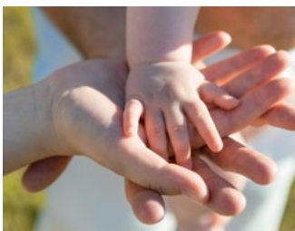
1 Tips voor alle belastingplichtigen

Een aantal plannen van het kabinet is nog niet definitief. Deze moeten nog door de Tweede en Eerste Kamer worden goedgekeurd. Welke dat zijn, kunnen wij u uiteraard vertellen. Ook worden nog steeds nieuwe plannen bekendgemaakt of worden er huidige plannen aangepast. Daarom overleggen wij graag met u of het verstandig is wel of geen stappen te zetten.