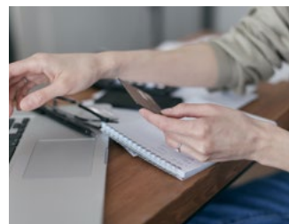
7 Tips inzake de btw