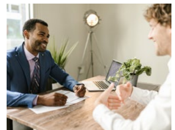
4 Tips voor werkgevers