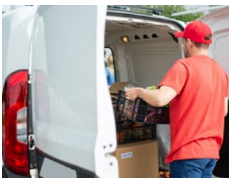
5 Tips voor de automobilist