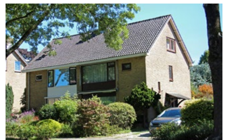
6 Tips voor de woningeigenaar