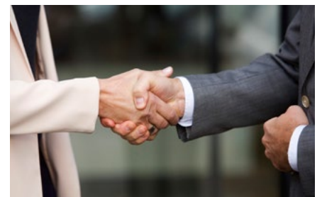
3 Tips voor de bv en de dga