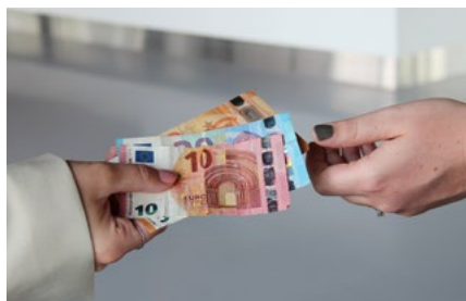
4 Tips voor werkgevers