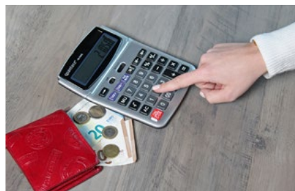
2 Tips voor de ondernemer in de inkomstenbelasting