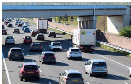
5 Tips voor de automobilist