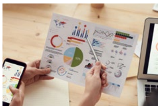
5 Wet DBA