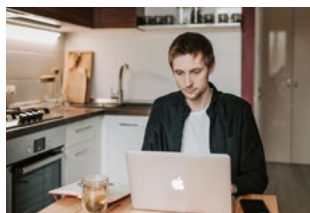
7 Corona en thuiswerken