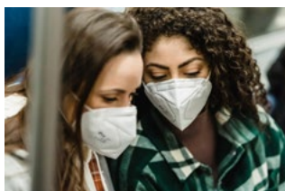
9 Corona en bijzonderheden werknemer