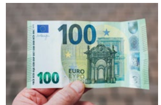
4 Wet tegemoetkomingen loondomein