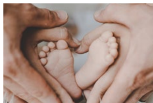
6 Varia Arbeidsrecht en sociaal zekerheidsrecht