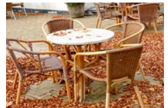
8 Tijdelijke Noodmaatregel Overbrugging Werkgelegenheid