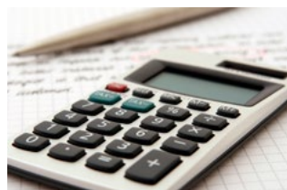
10 Overige corona-actualiteiten voor werkgevers