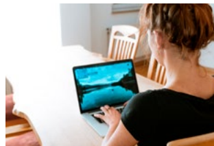
7 Corona en thuiswerken