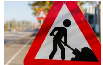
4 Wet tegemoetkomingen loondomein