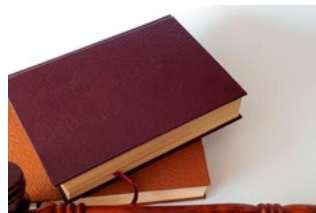
6 Varia Arbeidsrecht en sociaal zekerheidsrecht