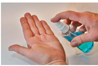
9 Corona en bijzonderheden werknemer