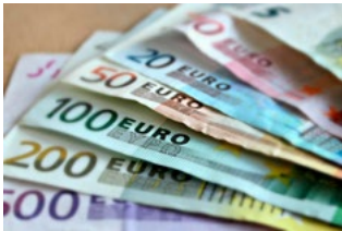
1 Varia loon- en premieheffing

Tevens bevat deze editie informatie over bijvoorbeeld de auto van de zaak, de thuiswerkvergoeding, de WKR en de transitievergoeding. De hoofdstukken 7 tot en met 10 in deze special gaan in op diverse coronagerelateerde maatregelen.