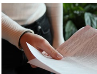
5 Subsidies en tegemoetkomingen