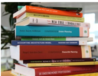
5 Subsidies en tegemoetkomingen