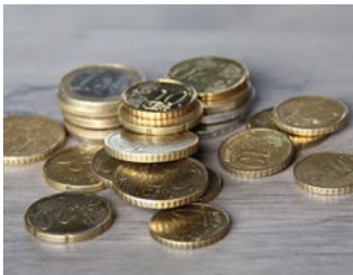
1 Tarieven loonbelasting, premies en heffingskortingen

Deze Special bevat actuele cijfers en relevante wet- en regelgeving op onder meer het gebied van de loonbelasting, gebruikelijk loon, de auto van de zaak, de WKR, subsidies voor de werkgever, diverse arbeidsrechtelijke zaken en pensioenen. Aan het einde van dit document is een aantal tabellen met cijfers en tarieven voor 2024 opgenomen.