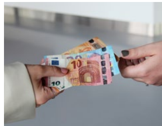
2 Gebruikelijk loon en vrijwilligersvergoeding