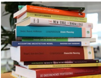
5 Subsidies en tegemoetkomingen