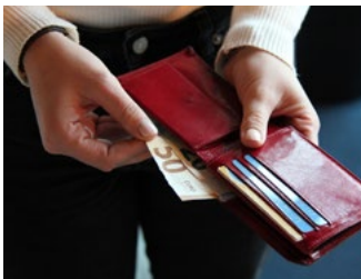
5 Subsidies en tegemoetkomingen