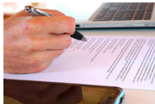
6 Varia Arbeidsrecht