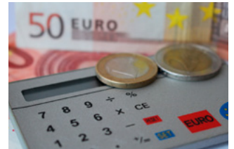
4 Wet tegemoetkomingen loondomein