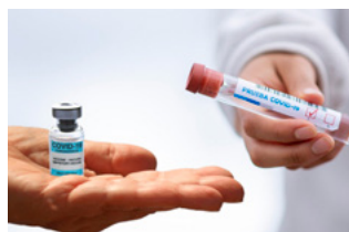
10 Overige corona-actualiteiten voor werkgevers