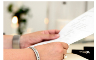
8 NOW (Tijdelijke Noodmaatregel Overbrugging Werkgelegenheid)