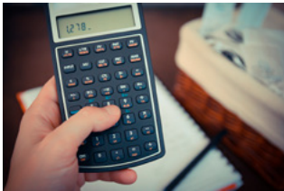
1 Varia loon- en premieheffing

Hoofdstuk 7 tot en met 10 in deze special gaan in op diverse coronagerelateerde maatregelen.