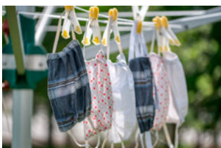
9 Corona en bijzonderheden werknemer