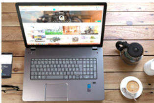
5 Wet DBA