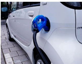
5 Vervoer en verduurzaming