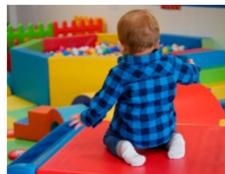
7 Overige, eerder aangekondigde en te verwachten voorstellen

Deze special bevat voorstellen van het kabinet die de komende periode in het parlement worden behandeld. De voorgestelde maatregelen treden per 1 januari 2022 in werking, tenzij anders is vermeld.