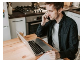
8 Overige eerder aangekondigde en te verwachten voorstellen