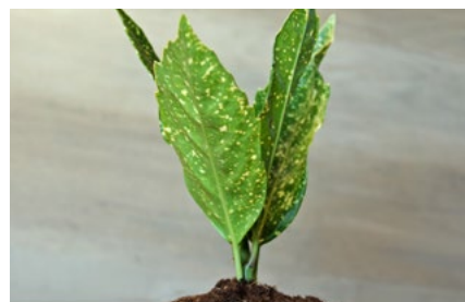
8 Verduurzaming en klimaat