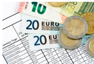
3 Tips voor de ondernemer in de inkomstenbelasting