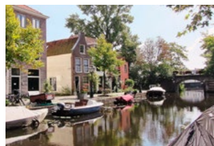
7 Tips voor de woningeigenaar