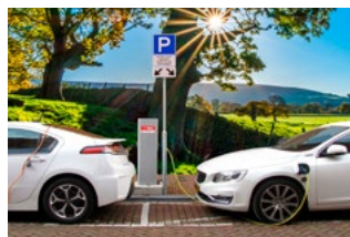
6 Tips voor de automobilist