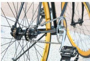
5 Tips voor werkgevers