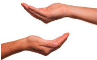
1 Tips voor alle belastingplichtigen

De tips zijn onderverdeeld in zeven categorieën: