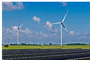
2 Tips voor ondernemers