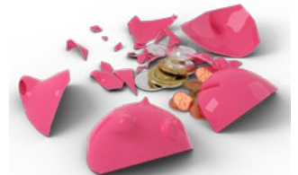
4 Tips voor de bv en de dga