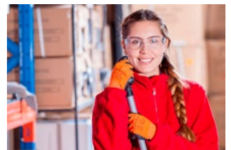
4 Wet tegemoetkomingen loondomein