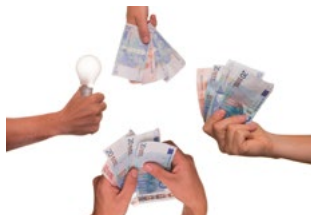
3 Arbeidsrecht en varia