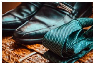
6 Dga: gebruikelijk loon en pensioen in eigen beheer