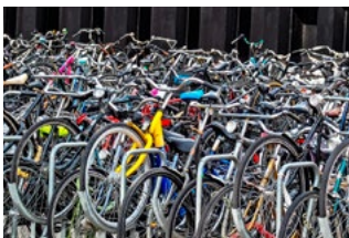
1 Varia loon- en premieheffing

Tevens bevat de Special onder meer actuele cijfers en informatie over de bijtelling auto, fiets van de zaak, de vrijwilligersregeling, WBSO en transitievergoeding.