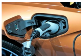
7 Bijtelling auto