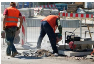
5 Wet DBA