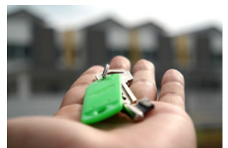
4 Eigen woning