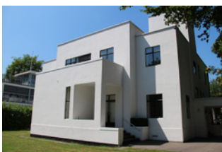
5 Formeel belastingrecht