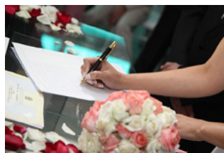
2 Vermogende particulier