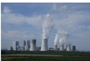
9 Overige maatregelen